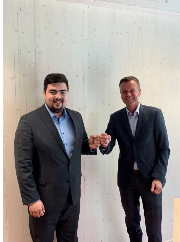
Niklas Wagener, Bündnis 90/Die Grünen, 25.03.22