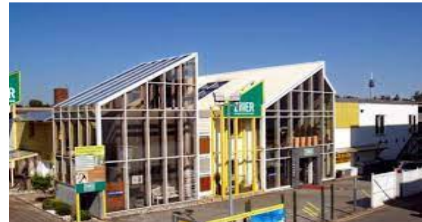
Ziller, Böden Türen Garten, Nürnberg