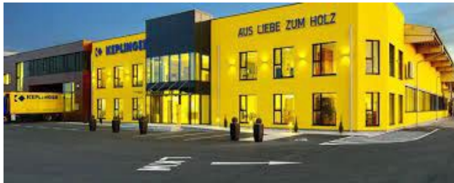
Keplinger GmbH, Traun