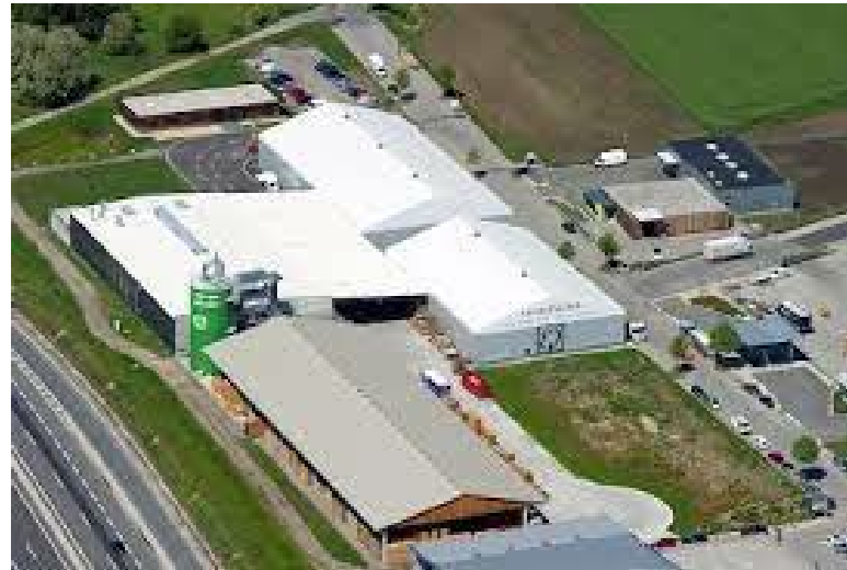
Sachseneder GmbH, Grafenwörth