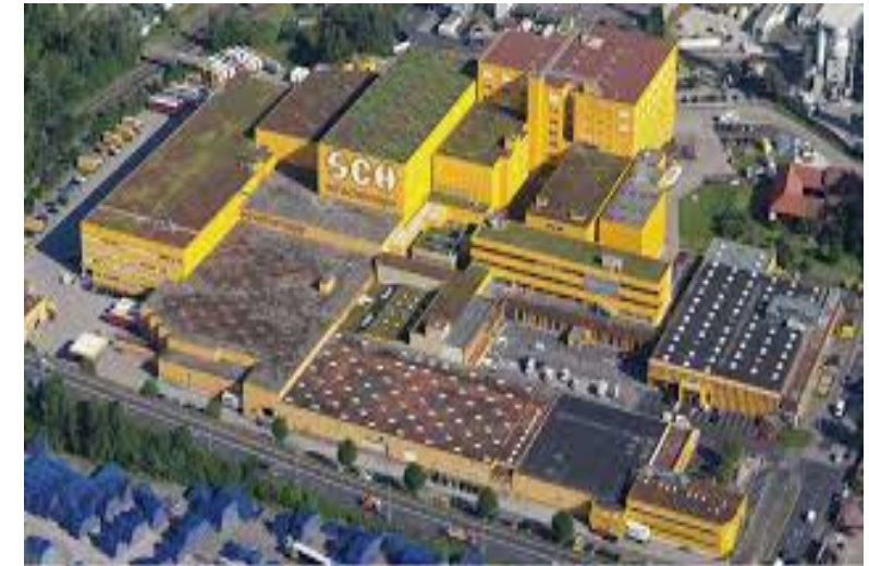
Schachermayer GmbH, Linz