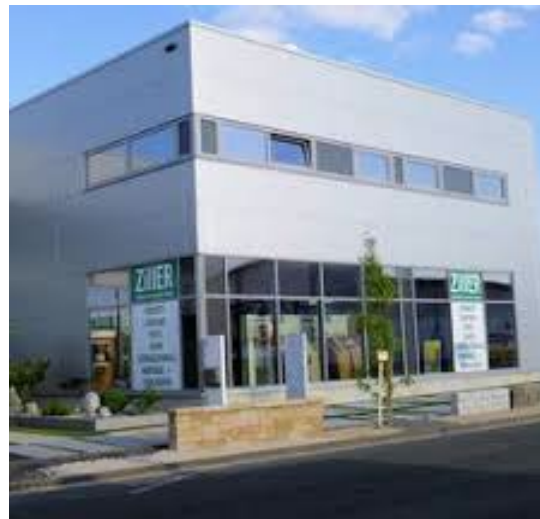
Ziller, Böden Türen Garten, Baiersdorf