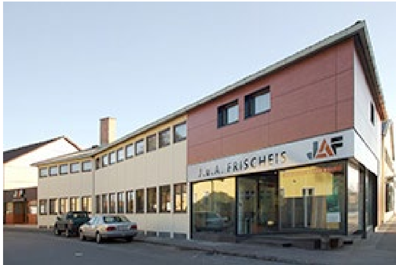
J. u. A. Frischeis GmbH, Stockerau