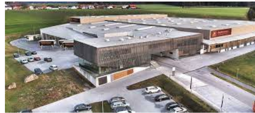
Tschabrunn-Hopferwieser GmbH, Lamprechtshausen